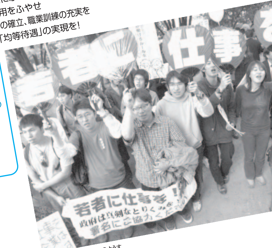
2003年10月19日の集会のようす

●TEL 03-3468-5301 ●メール work1212@dylj.or.jp ●ホームページ http://www.dylj.or.jp/